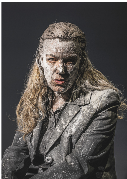
Fra Terror/is/me (2021), Odense Teater.

Langt det meste af det teater, I vil se på Odense Teater har dog karakterer, man kan tilgå psykologisk.