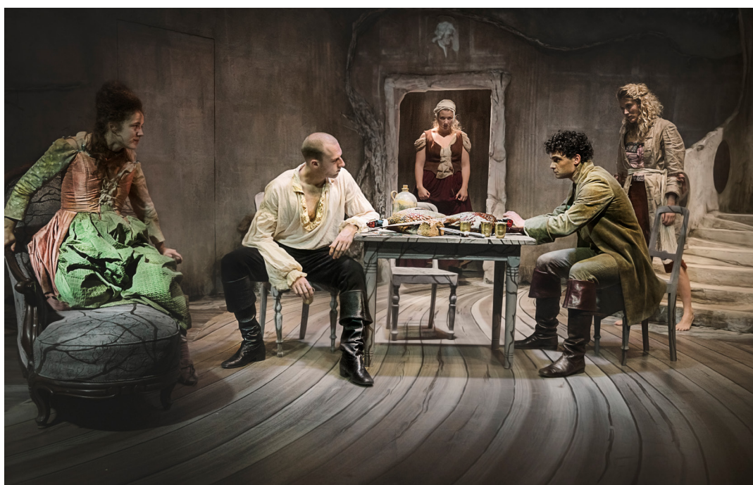
Stormfulde Højder, Odense Teater. 2021.