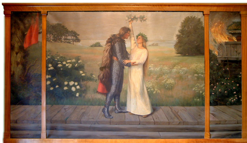
Agnes Sloth-Møller, "Hagbarth og Signe" (1918). Odense Teater.