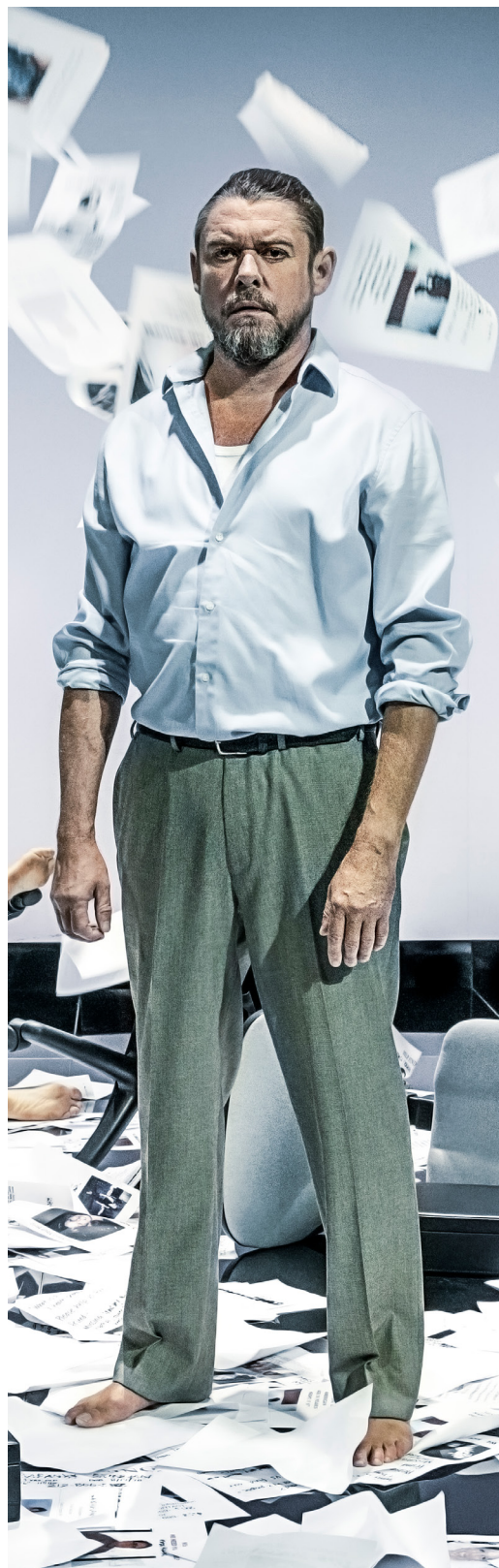
Fra Terror/is/me (2021). Odense Teater.