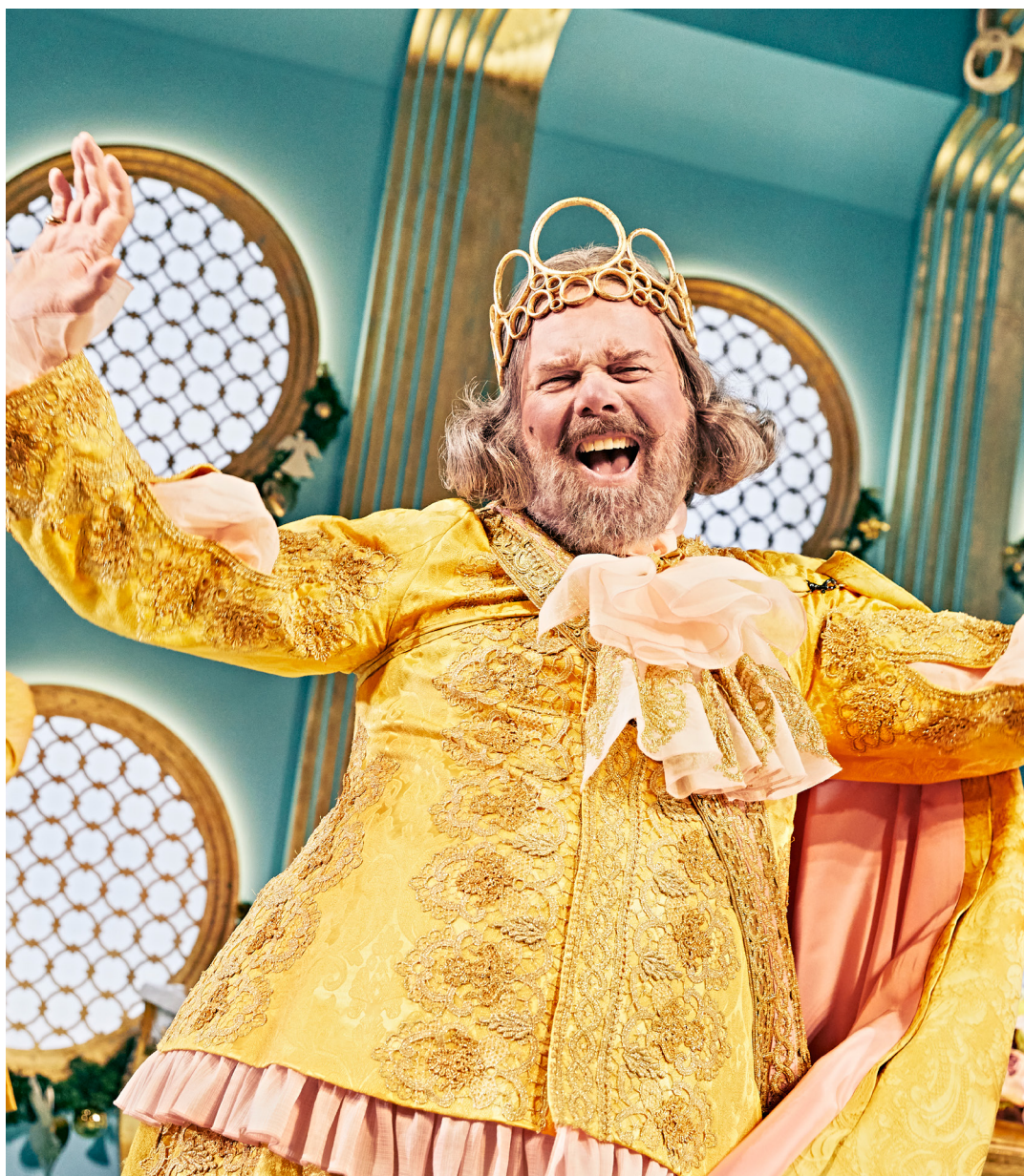
Jul på slottet, Odense Teater (2021).