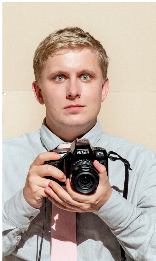
Fra En folkefjende (2021). Odense Teater & Nørrebro Teater.

Anmelderens brændstof er undren. Uden undren og nysgerrighed, ingen anmeldelse. Spørg dig selv, inden du skriver: Hvorfor kunne dette værk være så fantastisk, at det var svært at løsrive sig fra det? Hvordan var dette værk i stand til at ændre din verden? Eller omvendt: Hvorfor lykkedes dette værk ikke, når nu intentionerne var så gode, og kunstnerne var så kompetente? Hvorfor overraskede eller fængede det ikke?