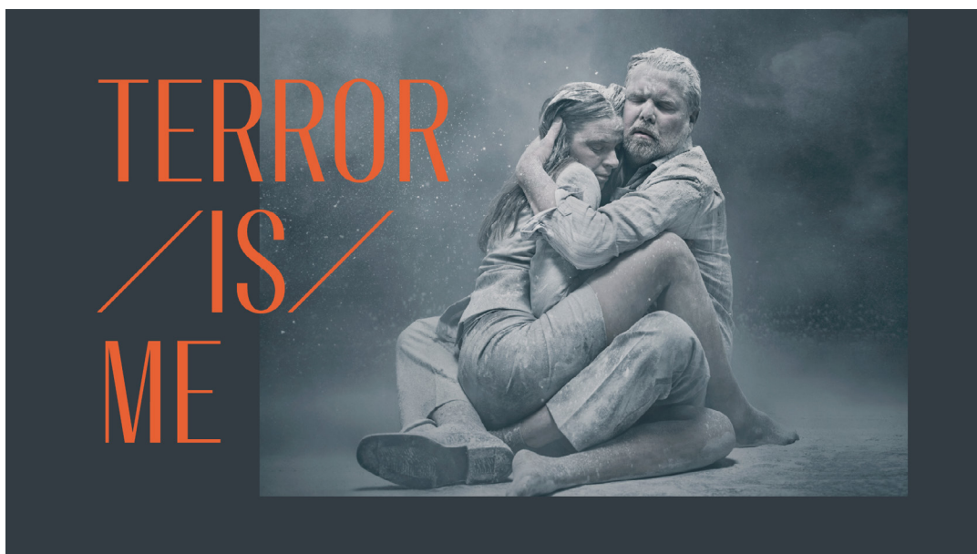
Terror/is/me, Odense Teater (2021).