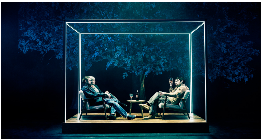
Fra Død Over Eliten, Odense Teater (2019).