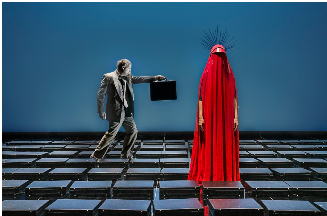
Terror/is/me, Odense Teater (2021).