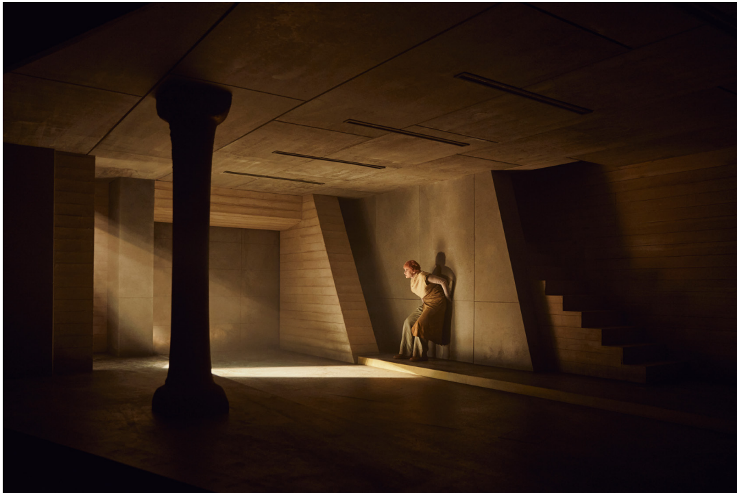
Elektra, Odense Teater (2022).