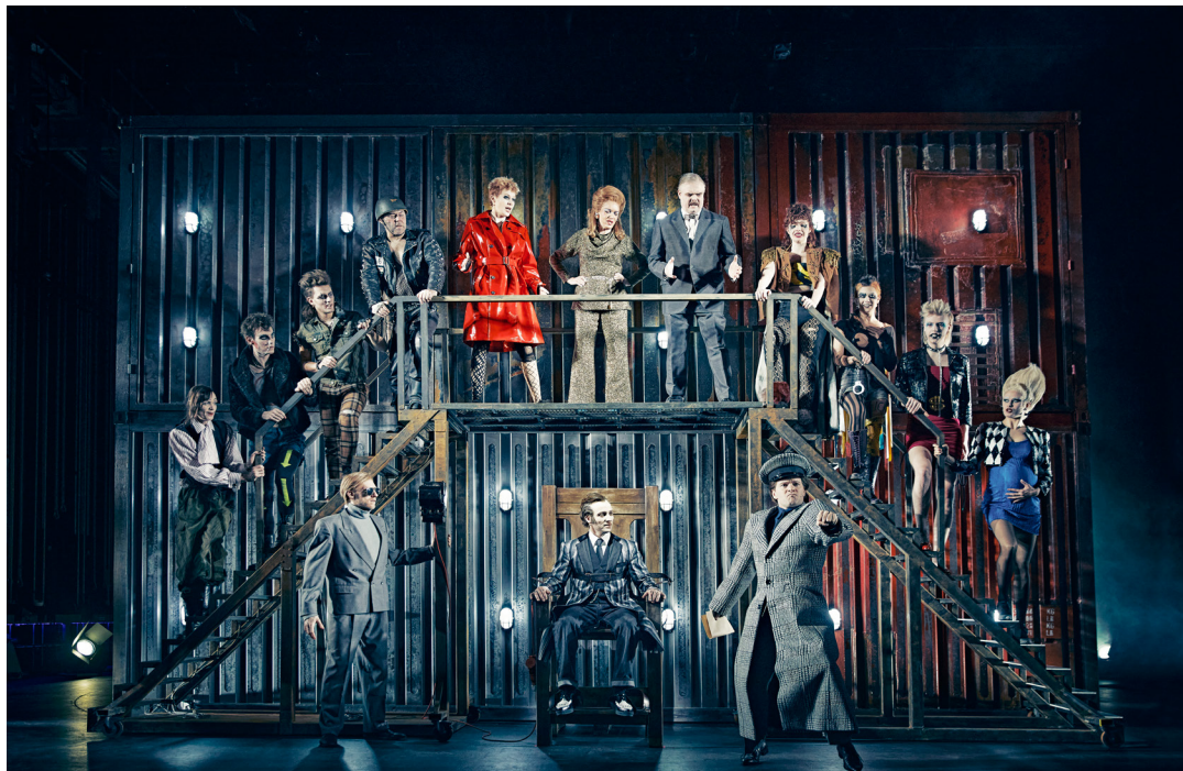
Laser og Pjalter, Odense Teater (2022).