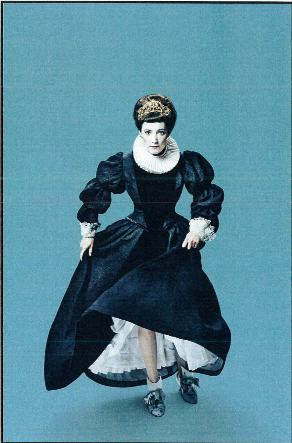
Forestillingen "Helligtrekongersaften"